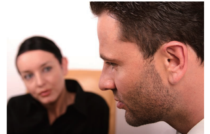
患者透過自助治療，主動接觸恐懼和減輕憂慮情緒，從而克服恐懼。